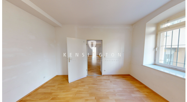
Zimmer zum Hinterhof