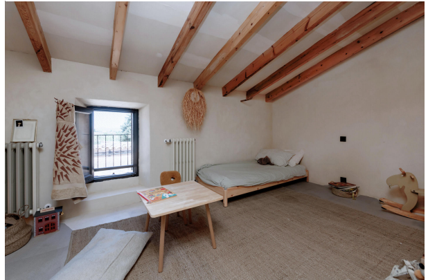
Bedroom 3 (1st floor)