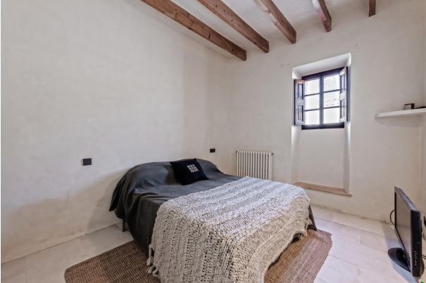
Bedroom 4 (ground floor)