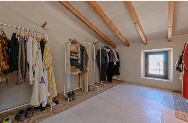
Bedroom 2 (1st floor)