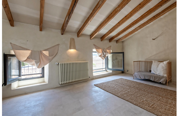
TV room (1st floor)